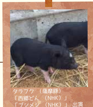
タラフク (薩摩豚) 「西郷どん (NHK)」 「プシメシ (NHK)」 出演