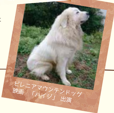
ピレニアマウンテンドッグ 映画「ハイジ」 出演