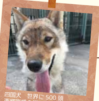
四国犬 世界に 500 頭 西郷隆盛の銅像の犬 「西郷どん (NHK)」 出演