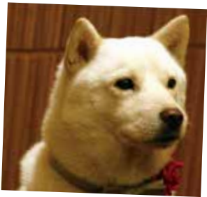
北海道犬 「ソフトバンクCM」 出演