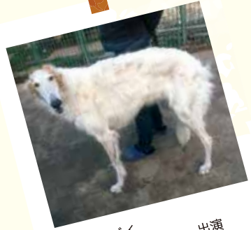
ボルゾイ 「獣医ドリトル」 出演

※動物の体調等の状況により、予告なく予定が変更になることがありますのでご了承ください