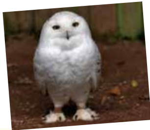
シロフクロウ 映画「ハリーポッター」 に出てくるものと同種